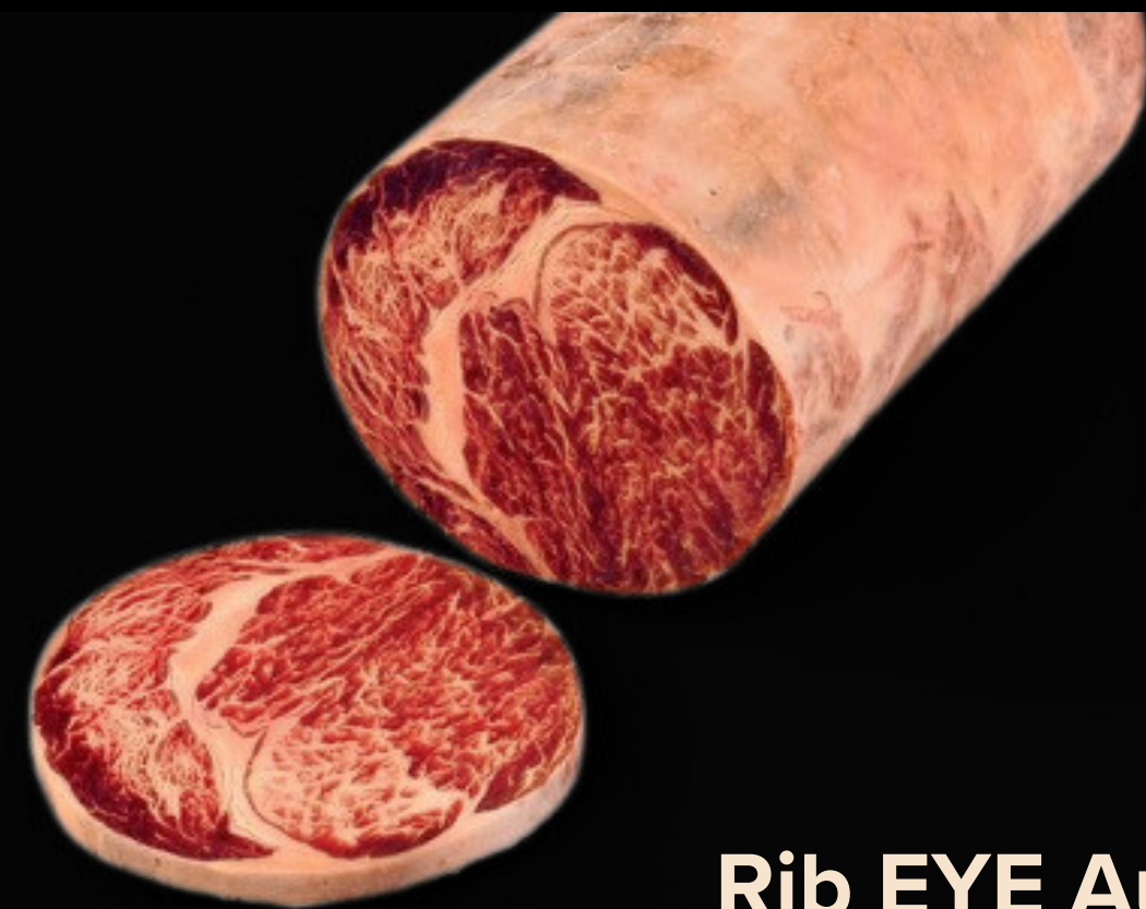
Rib EYE Australia