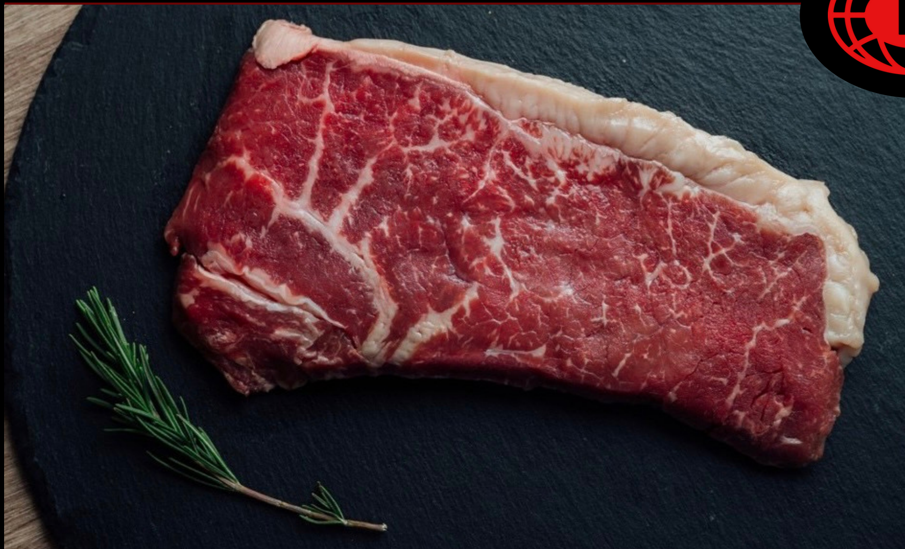
Strip lion Australia