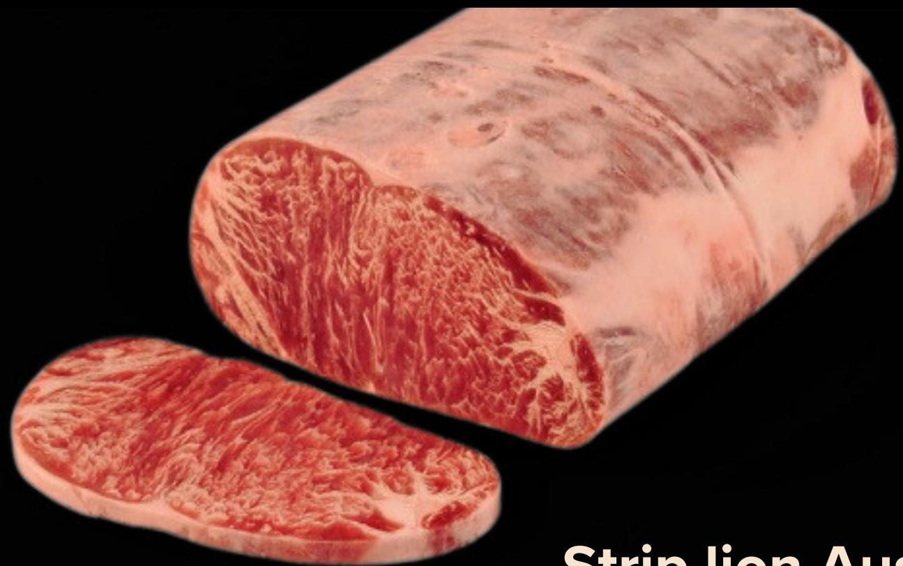
Strip lion Australia