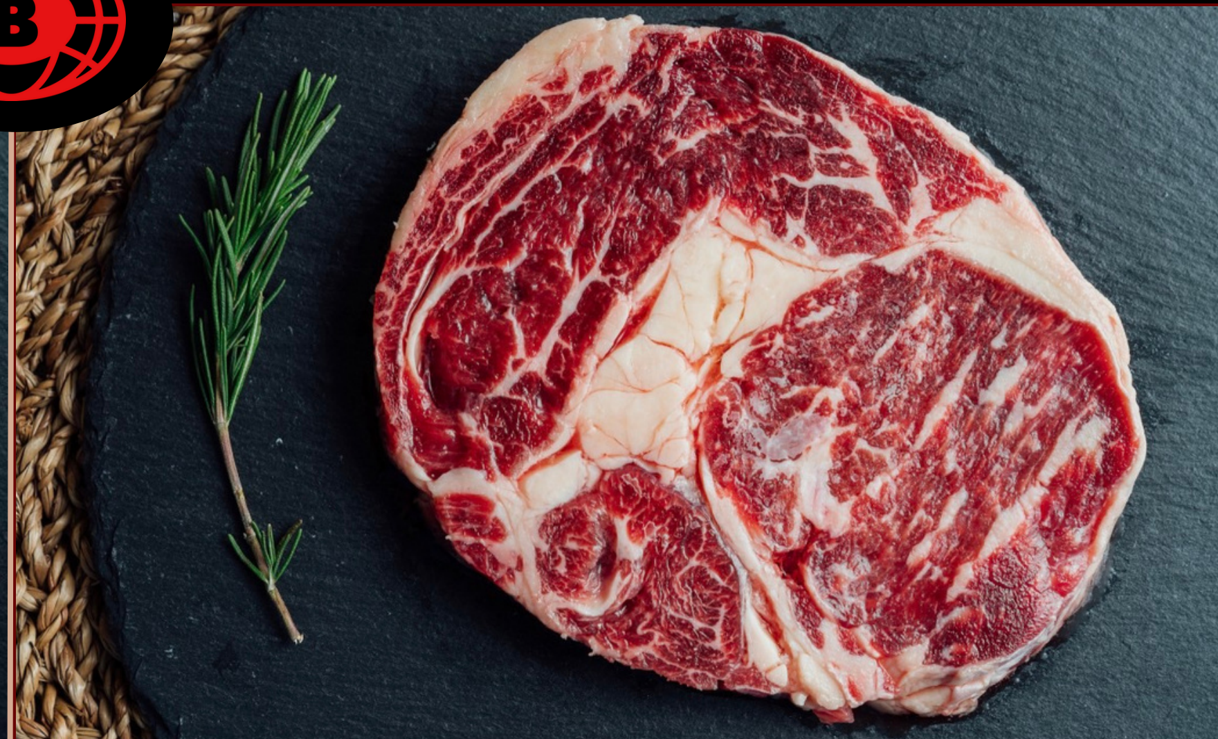
Rib eye Australia